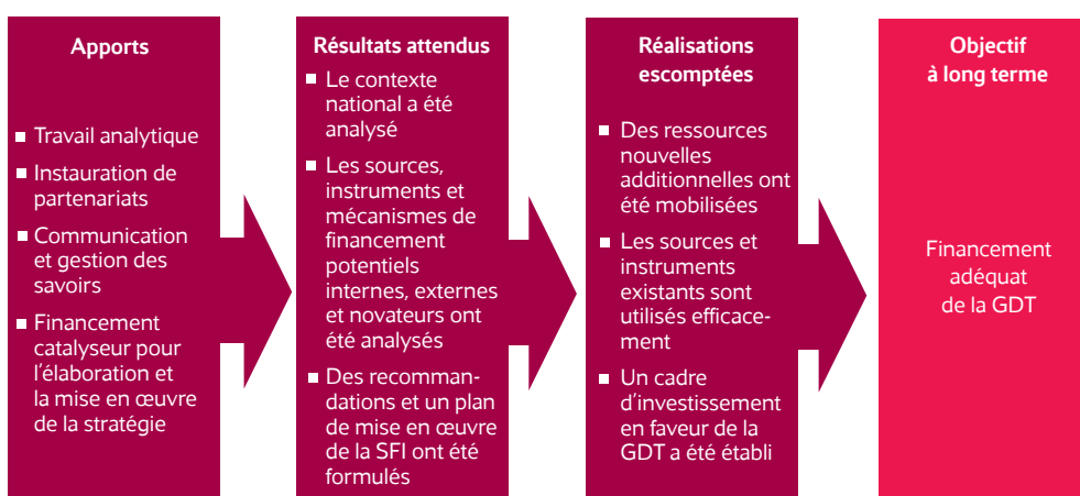
Figure 1 : Cadre analytique de la gestion axée sur les résultats du processus de la SFI

La SFI se compose donc des éléments clés suivants :